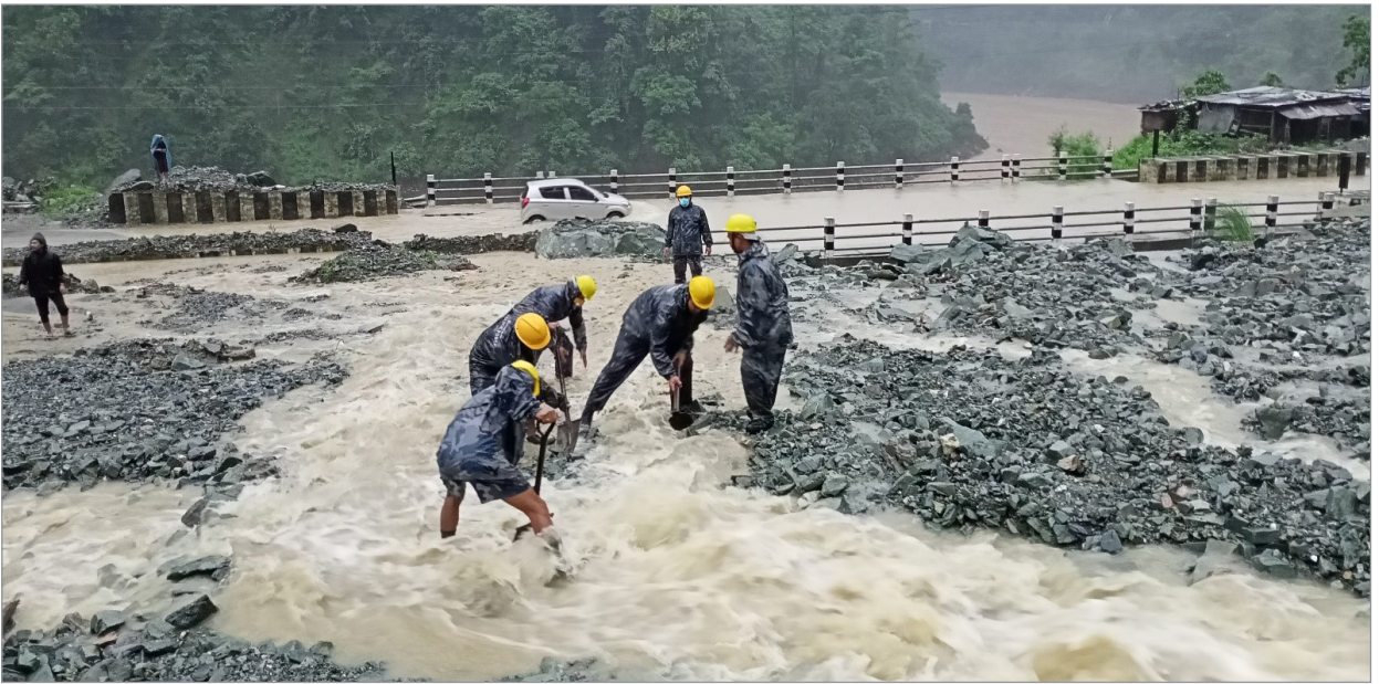
मुग्लिन नारायणगढ सडक खण्डमा आएको पहिरो व्यवस्थापन गर्दै सुरक्षाकर्मी