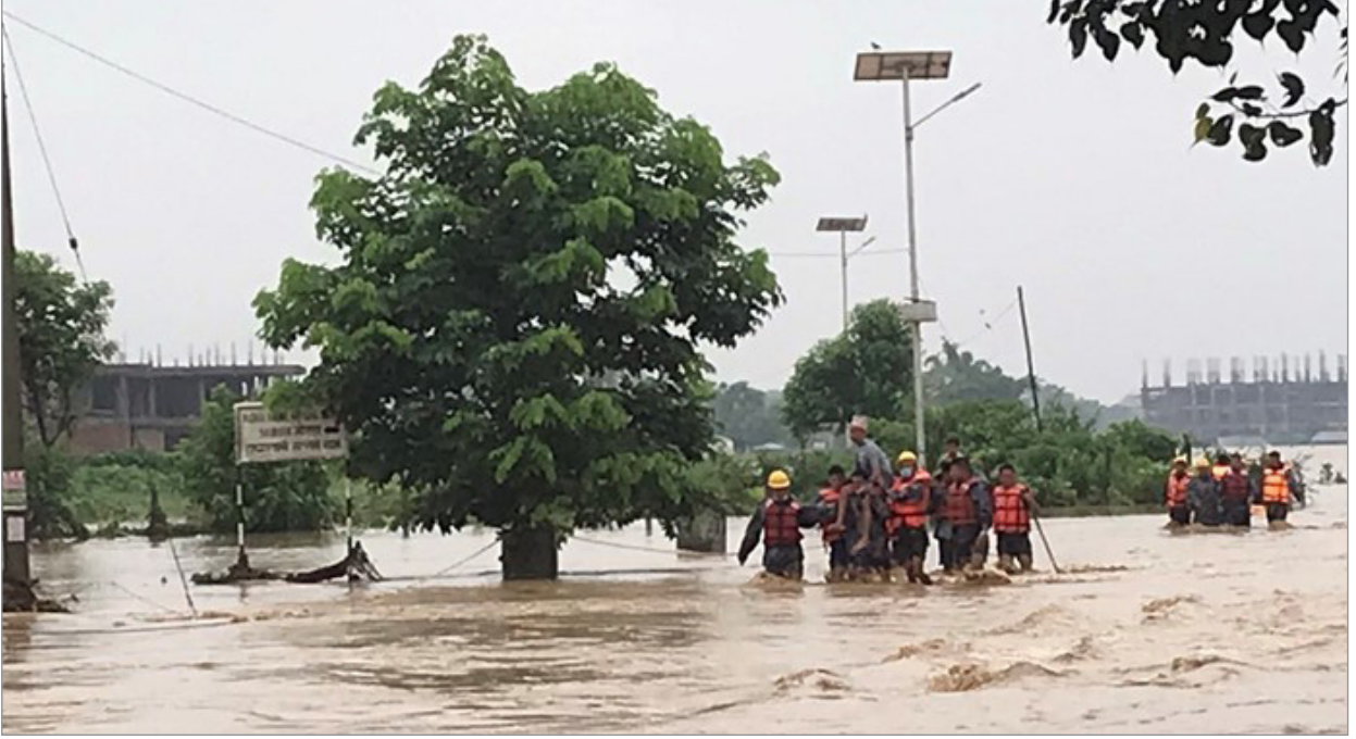
चितवनको राप्ती नगरपालिकामा अविरल वर्षापछि डुबानमा परेका नागरिकहरूलाई उद्धार गर्दै सुरक्षाकर्मी