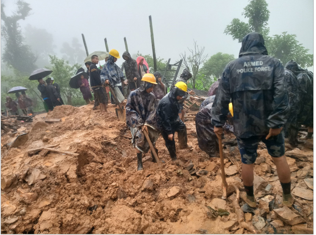
तनहुँमा गएको पहिरो प्रभावितहरुको उद्धारमा सुरक्षाकर्मी