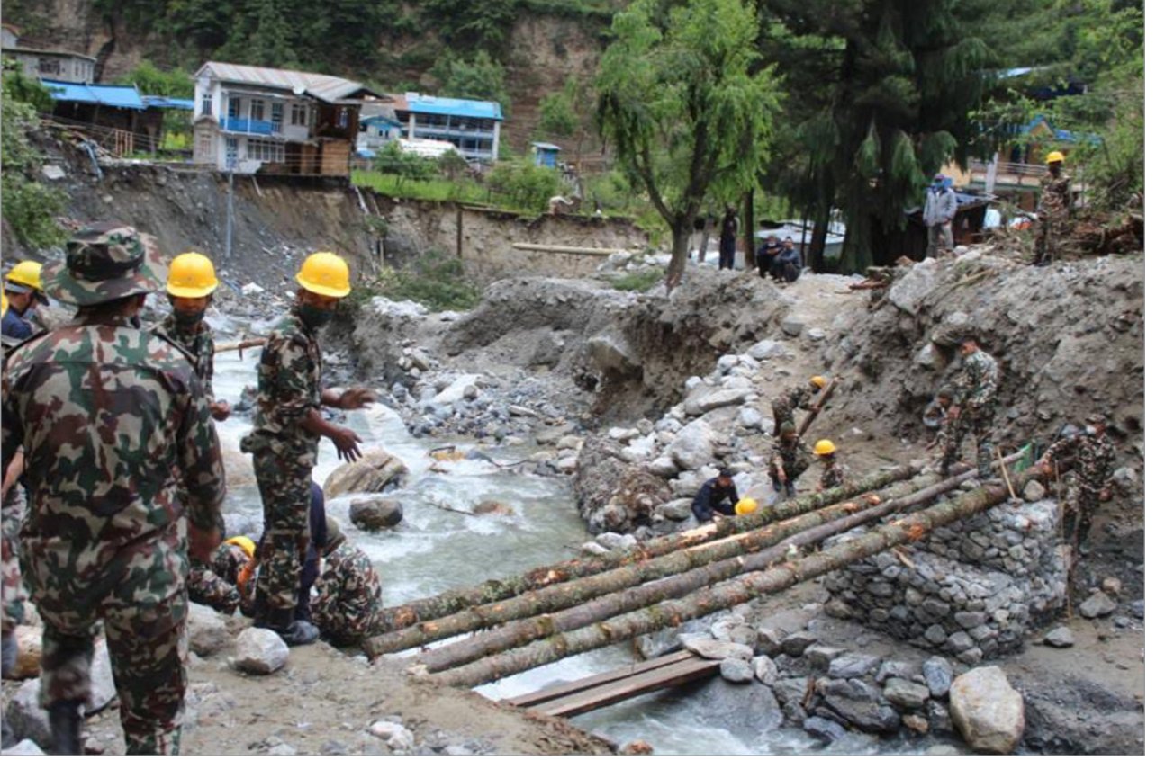
मनाङ्गको चामे गाउँपालिका ३ स्थित नयाँ बजार र चामे बजार जोड्ने घट्टेखोलामा काठे पुल बनाउदै सुरक्षाकर्मी।