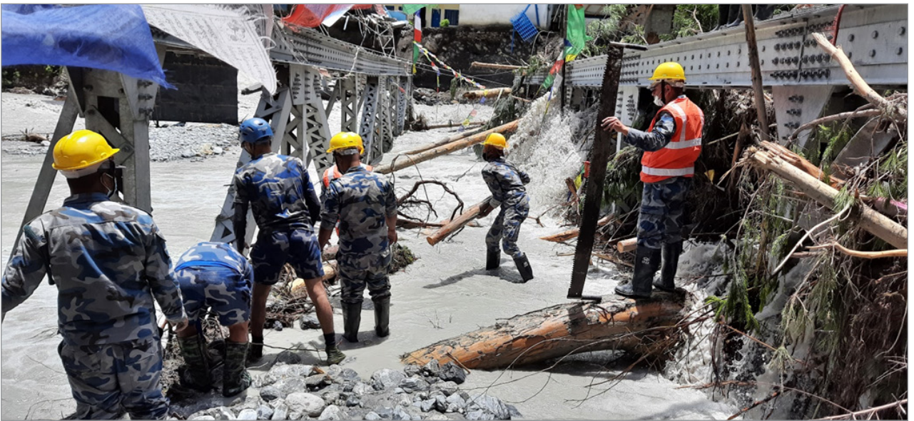
मनाङ्गको सदरमुकाम र माथिल्लो मनाङ्ग जोड्ने पक्की पुलमा बाढीले रुखहरु थुपारेपछि काटेर खोलाको बहाव खोल्दै सुरक्षाकर्मी।