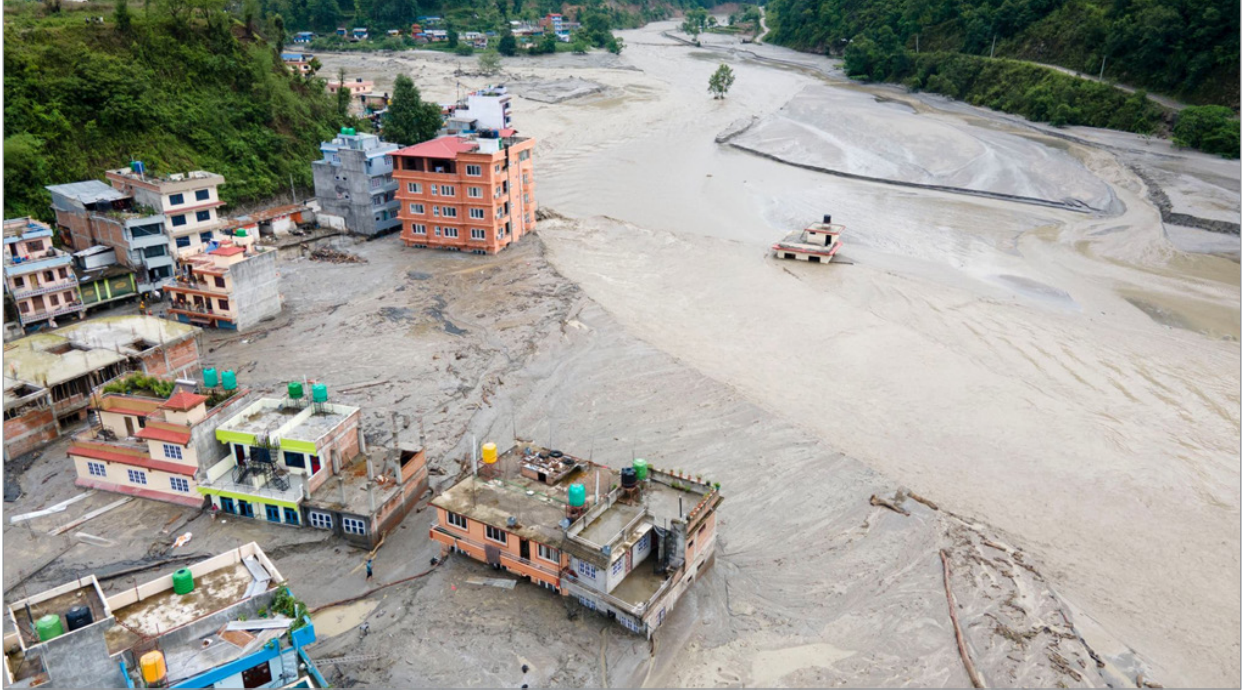
मिति २०७८ असार १ गते सिन्धुपाल्चोकको मेलम्ची गएको बाढी